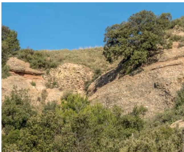
Castell de la Guardia

Sortim de l'Àrea del Coll de Can Maçana seguint el GR-172 que ens acompanyarà fins al Monestir, però avui degut a la importància de la muntanya i del Monestir de Montserrat travessarem a la comarca del Bages per gaudir de l'espectacularitat de l'entorn.