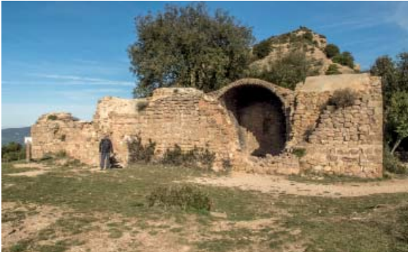
Sant Pau Vell