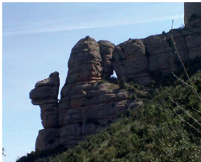
Roca Foradada i la Cadireta (massís de Montserrat)

Retrocedim al camí principal per continuar planejant fins a tornar-nos a desviar per pujar per un dret corriol a la Roca Foradada. Novament descendim al camí principal que ens portarà a passar per sota la roca anomenada la Cadireta i anirem resseguint per la part nord tot el massís, on hi ha les parets més agrestes. Podem observar les anomenades zones d'Agulles, Frares i Ecos i un cop travessat la Canal de la Llum, un dels torrents més importants que parteix el massís en dos, connectant en la seva part superior amb el torrent del Migdia.