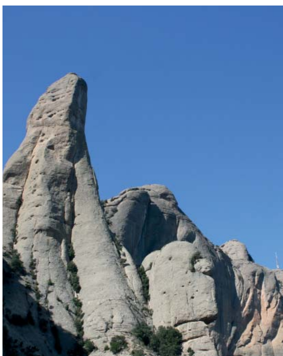
Cavall Bernat (massís de Montserrat)

Nosaltres continuem per sota les parets de Sant Jeroni i després de traspasar la canal de Sant Jeroni el camí davalla fins a gairebé tocar el Monestir de Santa Cecília, nosaltres continuem per sota de les parets anomenades l'Aeri, Diables, Cavall Bernat, Serrat de les Barretines i els Flautats entre les més importants, per arribar a la Plana la Vella i més tard Pla de la Trinitat fins al mirador dels Ermitans, on tenim una excepcional vista del Monestir. Poc després ja trobem les escales anomenades dels pobres que connecten el Monestir i Sant Jeroni, la punta més alta de tot el Massís de Montserrat de 1235 metres i un dels cent cims de la FECC. Nosaltres agafarem aquestes escales en sentit descendent fins a arribar al Monestir on donem per finalitzada l'etapa d'avui.