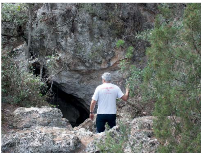
Coves del Mamut

Un cop a la pista anirem a travessar el riu Anoia, on just darrere nostre es troben els gegants pins de cal Ferrer i posteriorment un sender ens passa per sota d'una espectacular cinglera. Més endavant, tornem a passar el riu Anoia, poc després l'antiga colònia de la Fou i la carretera C15. Seguint camí ens aproparem a les laberíntiques coves del Mamut, formades per travertí, per ja arribar a la urbanització i al Castell de Cabrera, on finalitza l'etapa.