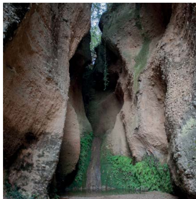
Salt dels Cucs o Cups

Des d'aquí davallant per un corriol un xic perdedor i que en el seu tram final pot estar parcialment embardissat, de nou ens trobem a la riera de Piera, que seguim fins a travessar el Riu Anoia, i per pista anem a trobar el torrent del Cargol. Cal remuntar-lo per un espectacular corriol i fent unes petites anades i tornades visitarem els paratges del salt dels Cucs o Cups i el salt del Cargol. Ara haurem de pujar per un malforjat corriol que en un parell de trams, unes cordes ens ajudaran a remuntar, fins al camí que planejant per sota el serrat de la Teia, ens portarà al salt de la Mala Dona. Prosseguint per diverses pistes ens encaminarem a la serra de la Guitza, per les Roques Planes, el punt més alt de la zona, i baixant per un malmès viarany, arribem a l'obaga del bosc de Cal Torres.