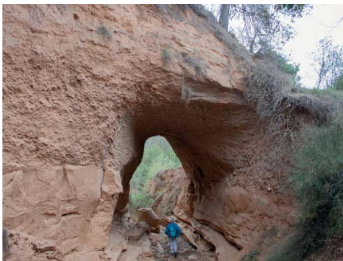
Túnel excavat per l'aigua

Des d'aquí davallant per un corriol un xic perdedor i que en el seu tram final pot estar parcialment embardissat, de nou ens trobem a la riera de Piera, que seguim fins a travessar el Riu Anoia, i per pista anem a trobar el torrent del Cargol. Cal remuntar-lo per un espectacular corriol i fent unes petites anades i tornades visitarem els paratges del salt dels Cucs o Cups i el salt del Cargol. Ara haurem de pujar per un malforjat corriol que en un parell de trams, unes cordes ens ajudaran a remuntar, fins al camí que planejant per sota el serrat de la Teia, ens portarà al salt de la Mala Dona. Prosseguint per diverses pistes ens encaminarem a la serra de la Guitza, per les Roques Planes, el punt més alt de la zona, i baixant per un malmès viarany, arribem a l'obaga del bosc de Cal Torres.