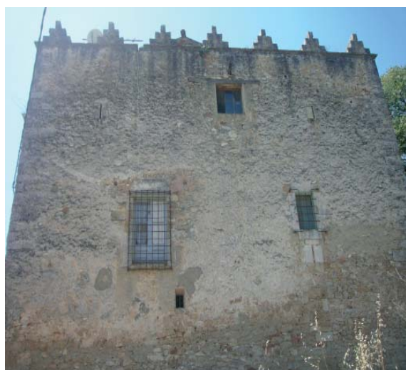
Castell de Cabrera

https://ca.wikipedia.org/wiki/Castell_de_Cabrera_(Anoia)