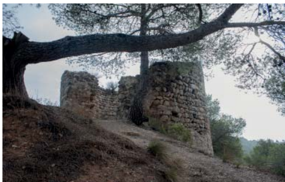
Castell de Ventosa