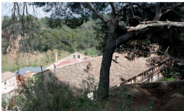
Colònia de la Fou