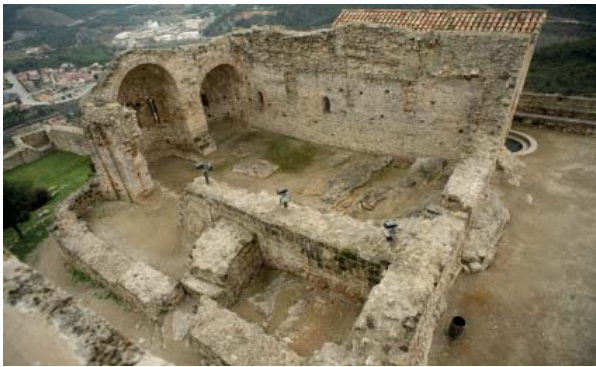
Església de Santa Maria i capella de Santa Margarida (Castell de Claramunt)