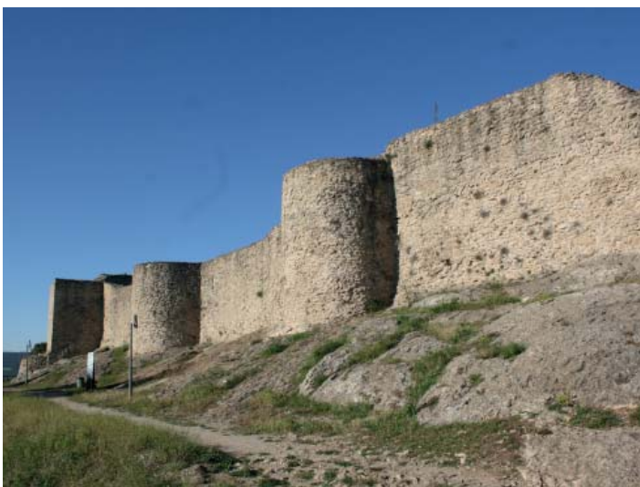
Castell de Claramunt

Només passar la pista el viarany s'enfila a un petit collet i un tros més endavant, farem unes giragonses per anar a caminar per als Esgavellats, un garbuix de curioses esquerdes entre roques, que val la pena guaitar. Un cop fora del laberint continuem en clara direcció oest fins a carenar la serra de Collbàs, deixant paral·lelament el camí de Carme a la nostra esquerra, travessant el coll de la Llentilla i fins al santuari de la Mare de Déu de Collbàs.