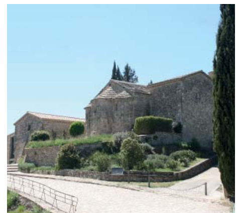
La Tossa de Montbui