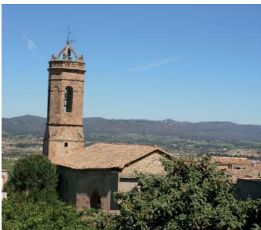
Església de Santa Margarida (Montbui nucli-antic)