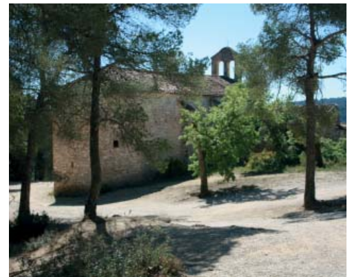
Mare de Déu de Collbàs

https://www.vilanovadelcami.cat/el-municipi/turisme/rutes/els-esgavellats.html