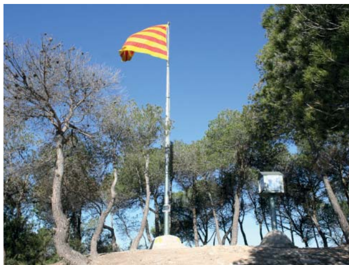
Pujol de la Guàrdia

Només passar la pista el viarany s'enfila a un petit collet i un tros més endavant, farem unes giragonses per anar a caminar per als Esgavellats, un garbuix de curioses esquerdes entre roques, que val la pena guaitar. Un cop fora del laberint continuem en clara direcció oest fins a carenar la serra de Collbàs, deixant paral·lelament el camí de Carme a la nostra esquerra, travessant el coll de la Llentilla i fins al santuari de la Mare de Déu de Collbàs.