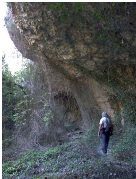
Fou de Cal Mila

Des d'aquí, ens dirigim a l'oest per un corriol en baixada fins a la font de clot de Can Gol, continuarem per la pista al costat del torrent de Cal Puça, travessarem la carretera C-37 cap a Cal Felip.