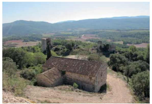
Església de Santa Maria de Miralles Torre Albarrana

https://patrimonicultural.diba.cat/element/castell-de-miralles