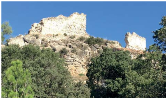
Castell de Miralles