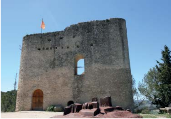
Castell de la Tossa