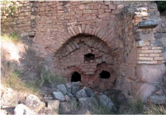
Cal Diabló (antiga Teuleria)