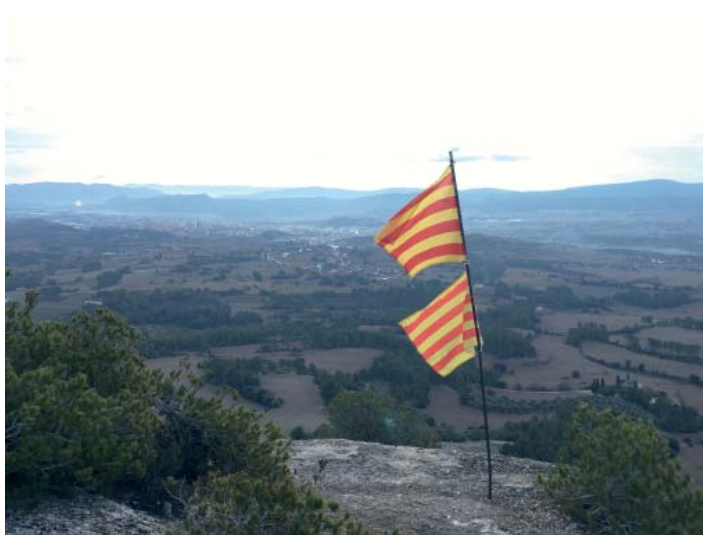
Mirador de l'Elia

Continuem al nord pujant al cim del Puig de Sant Miquel, uns metres abans hem deixat les poques restes del Castell d'Ardesa. Planejem per la Serra de les Malloles, agafem el primer corriol a la nostra esquerra que ens portà per una forta baixada a la plaça de les Bruixes. Continuem per la Rasa de Morro Curt seguint el curs del torrent per després enfilem-nos per un corriol i arribar al Castell i l'església de Santa Maria de Rubió.