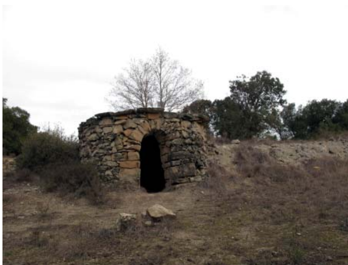
Barraca de pedra seca

Des de l'ermita de Sant Genis comencem l'etapa direcció nord, creuen l'antiga N-II pujant per un estret camí i en arribar a una pista principal la continuem fins a deixar la masia de Cal Puiggròs a la nostra esquerra continuant, ja en el camí de Cal Cesc ens enfilem i després de diverses giragonses per un camí entre bosc arribem a les ruïnes de la masia i teuleria de Cal Diabló.