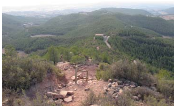
Puig de Sant Miquel