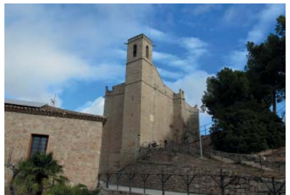
Santa Maria de Rubió

https://ca.wikipedia.org/wiki/Esgl%C3%A9sia_de_Santa_Maria_de_Rubi%C3%B3