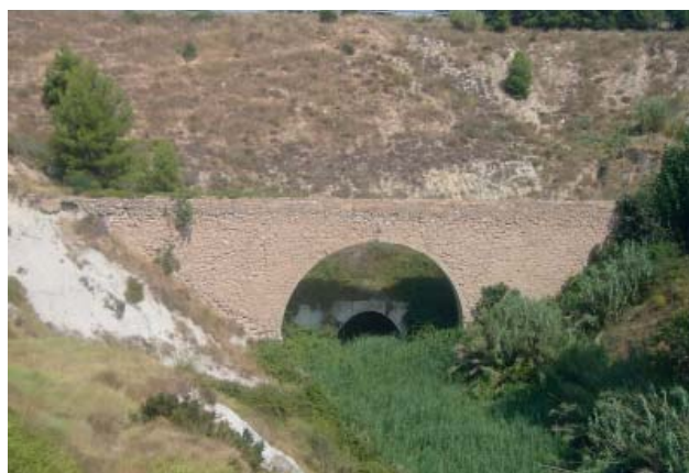
Aqüeducte de l'Espelt