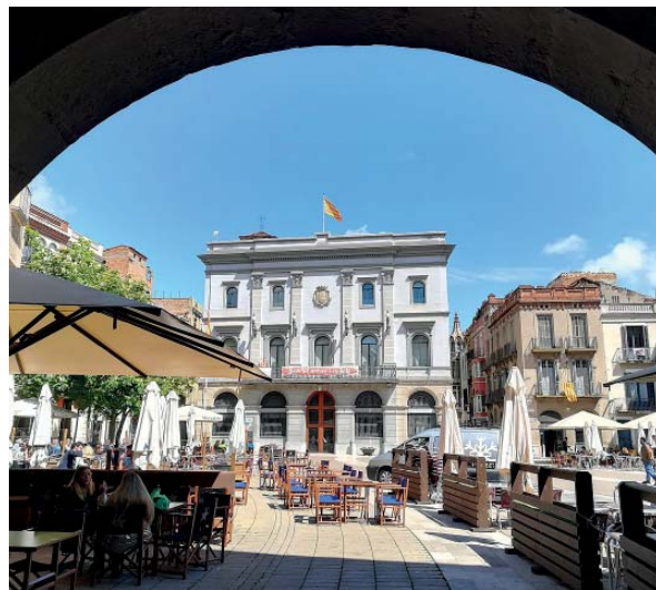
Plaça de l'Ajuntament (Igualada)