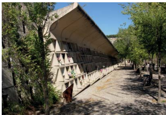
El Cementiri Nou d'Igalada

https://ca.wikipedia.org/wiki/Muralles_d%27Igalada