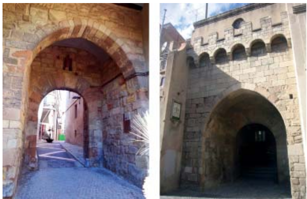
Portal d'en Vives i el Portal de la Font Major (Igalada)