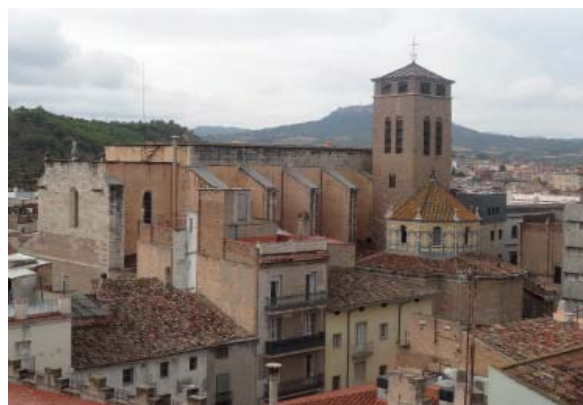
Basilica de Santa Maria (Igalada)

https://ca.wikipedia.org/wiki/El_Rec_d%27Igalada