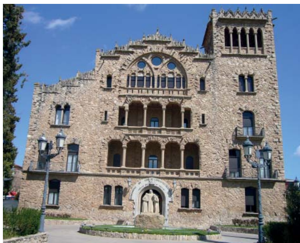
L'Asil del Sant Crist (Igualada)

https://ca.wikipedia.org/wiki/Asil_del_Sant_Crist