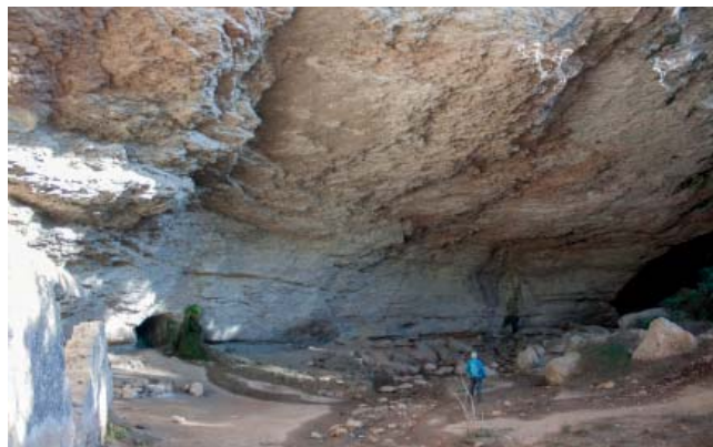
Balma de Can Solà