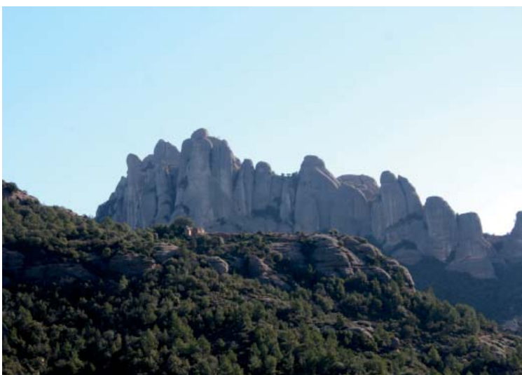
Massis de Montserrat

Sortint del Castell d'Òdena pels carrers del centre de la població direcció el Puig d'Aquilera primer per camí i després continuant per un corriol que remuntarem fins al cim. Aquest indret havia estat un important punt d'observació antiaèria en la guerra civil i ofereix una espectacular vista de tota la Conca d'Òdena. Ara planegem un tram per després davallar fins a la Vall de Sant Feliu travessant per sota la carretera C15 i passar per les masies de Cal Francolí de Sant Feliu i Can Aguilera, més endavant poc abans de travessar el Torrent de Sant Feliu ens troben uns metres de fort pendent de baixada força relliscós.