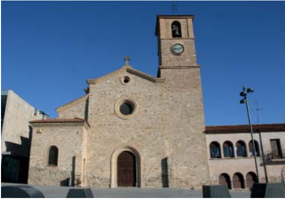
Sant Pere Apòstol (Òdena)