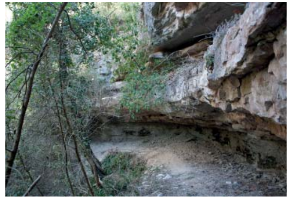
Cova del Sostre

https://www.encyclopedia.cat/gran-encyclopedia-catalana/odena-0