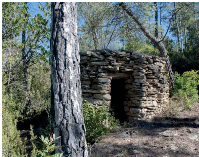
Barraca de la vinya del Forner

Passat el torrent, enfilem per unes marrades per l'obaga del Francolí, planegem vorejant els turons del Catarro i la Serra dels Ninots fins a trobar el Torrent de Cal Tardà que remuntem un tram i després de travessar-lo per un lloc no massa evident, continuem pel camí de Cal Serrador on més endavant podem desviar-nos uns metres per visitar la balma del Sostre (amagatall de la gerra civil). Proseguim per pista fins a travessar la Serra de la Fam, i després per un corriol força desdibuixat i perdedor, fins a travessar l'antiga N2 al coll del Bruc i dirigir-nos al Torrent de la Font de Can Sola, on es troba la balma més gran de Catalunya.